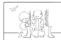
4. A bűnbocsánat szentsége