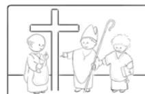
6. Az egyházi rend