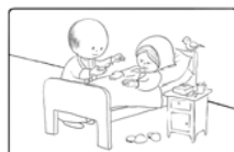
5. A betegek kenete