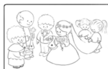
7. A házasság