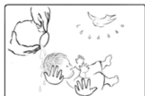
1. A keresztség