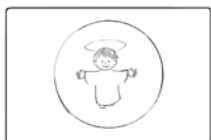
3. Az Eukarisztia (Oltárszentség)