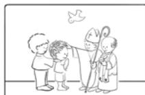
2. A bérmálás